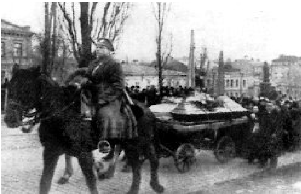
Перепоховання загиблих під Крутами на Аскольдовій могилі.