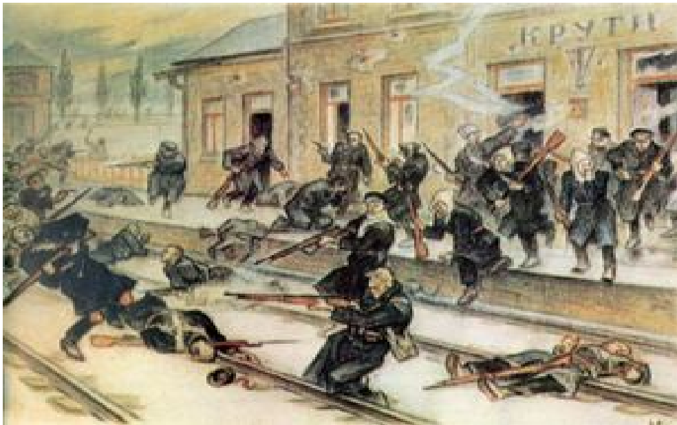
Леонід Парфецький. Бій під Крутами. Акварель