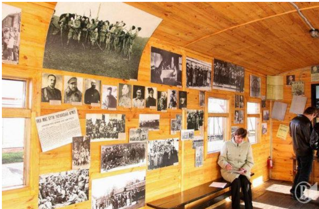
Всередині вагону-музею.