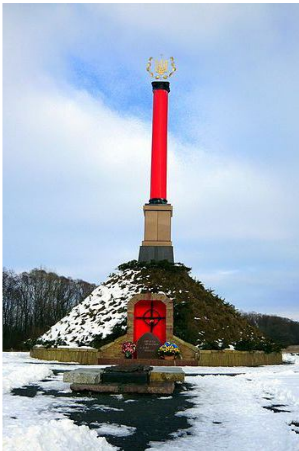
Меморіальний комплекс «Пам'яті Героїв Крут»