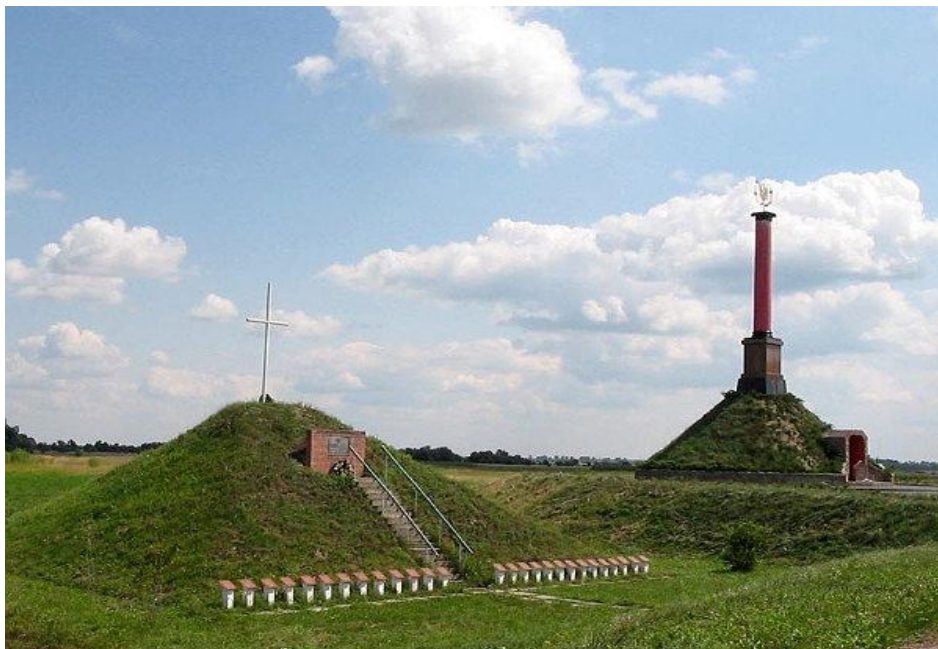
Меморіальний комплекс «Пам'яті героїв Крут» Станція Крути. Символічна могила (ліворуч) і сучасний меморіал загиблим студентам у вигляді колони Червоного корпусу Київського університету.