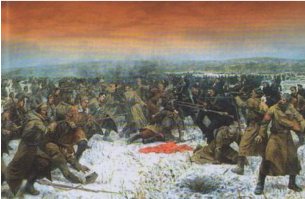
Бій під Крутами. Фото з обкладинки книги «Крути. Січень 1918 року»