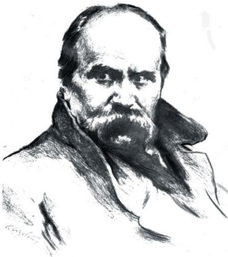
Тарас Григорович Шевченко 1814-1861